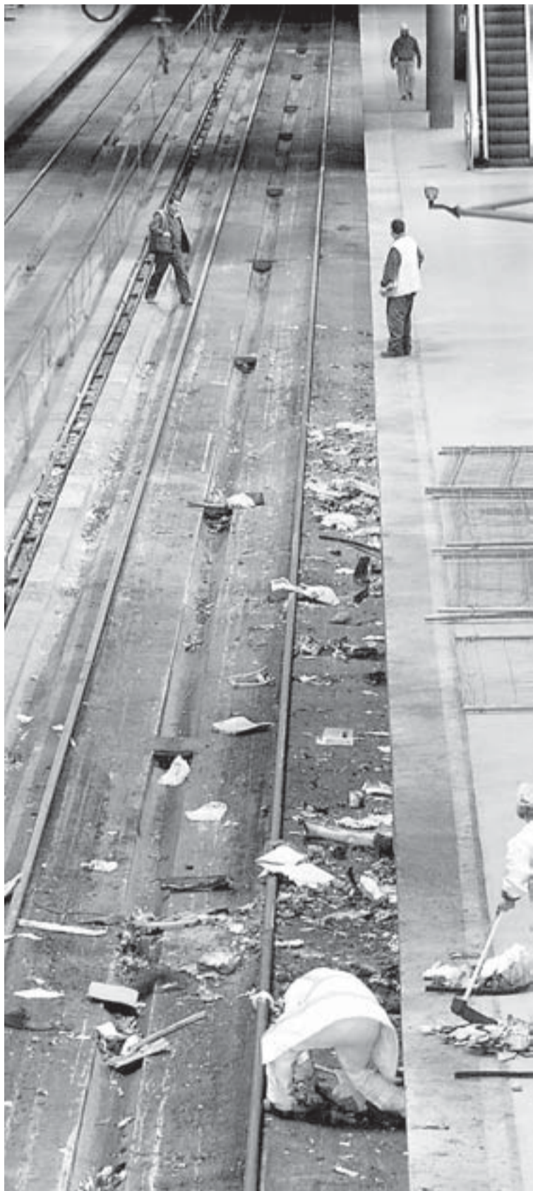
Operarios limpian las vías en la estación de Atocha.

► En Madrid se utilizó un explosivo que ETA no usa desde hace 10 años